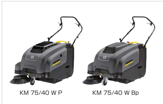
※仕様変更のため製品のハンドル形状は写真とは異なります。