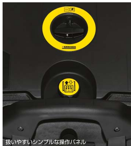
扱いやすいシンプルな操作パネル