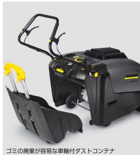
ゴミの廃棄が容易な車輪付ダストコンテナ