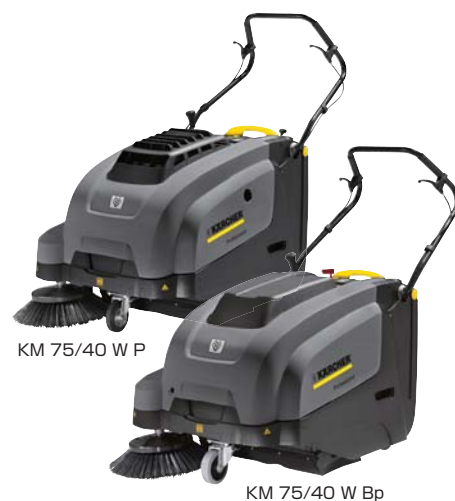
KM 75/40 W P